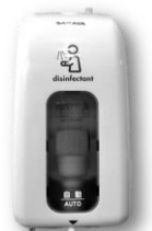
アルコール自動噴霧器