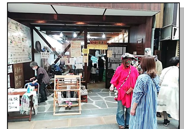
4月の商店街フリマ