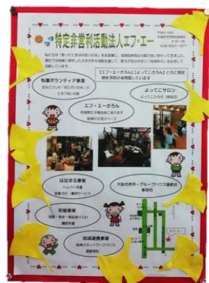
エフ・エー紹介展示