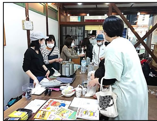
親子防災クッキング

久しぶりにサロンを開いて、人が居るといいう光景を見て、「やっぱりこうでなくっちゃ！」という思いがこみ上げてきました。